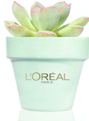
PC118 MINT PASTEL