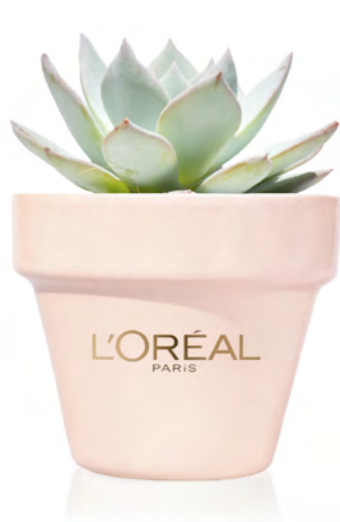
PC117 ROSA PASTEL