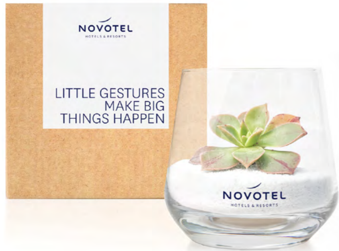
PC108 ESSENTIAL Ø 9,5 x 10,5 cm