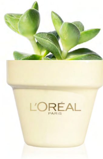
PC119 AMARILLO PASTEL