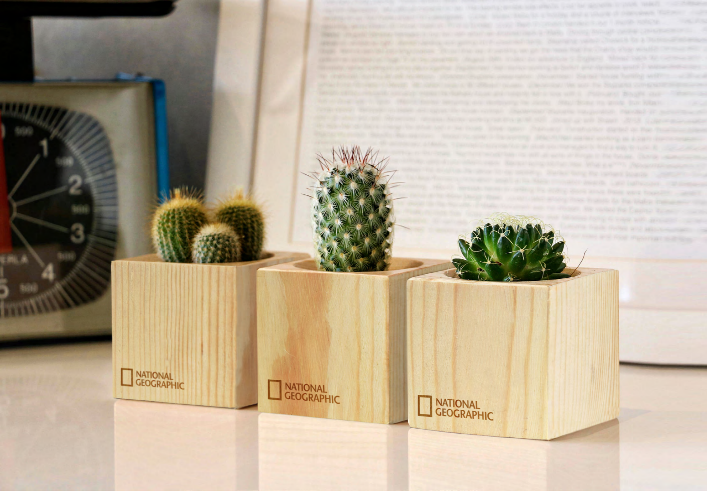
PC127 WOOD PINO S. 7 x 7 x 7,5 cm + altura planta